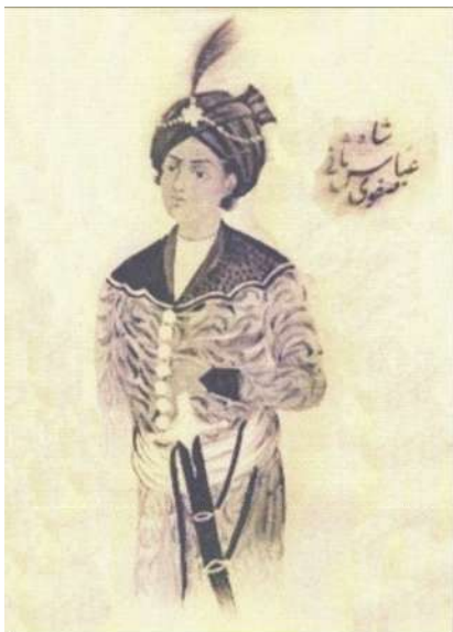
Шах Аббас II (1642-1667 гг.)