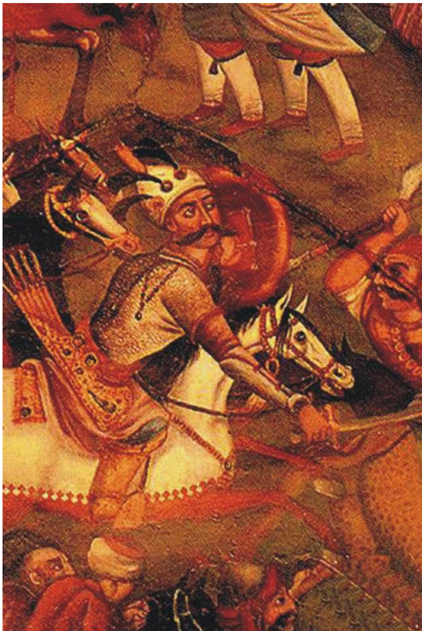
Шah Аббас I (1577-1629 гг.)