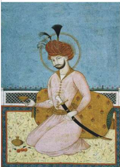
Шah Аббас I (1587-1629 гг.)