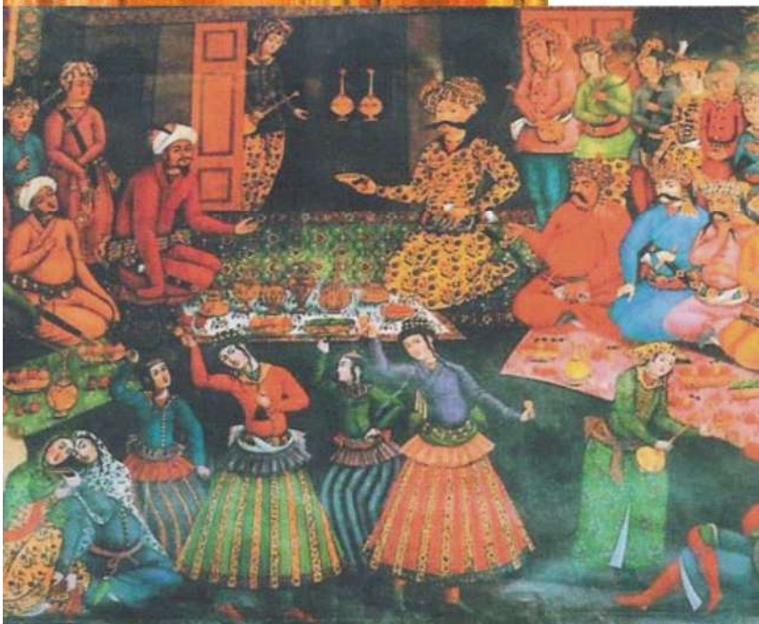
Прием иностранных послов шахом Аббасом I