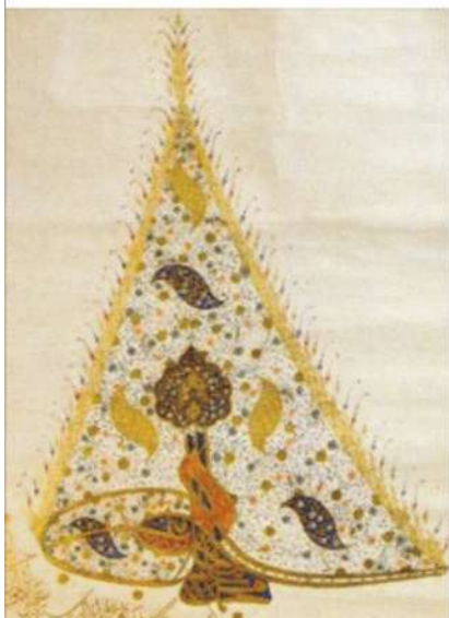
Тугра (символ) Сефевидов