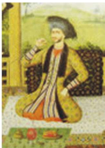
Шах Сулейман (1667-1694 гг.)