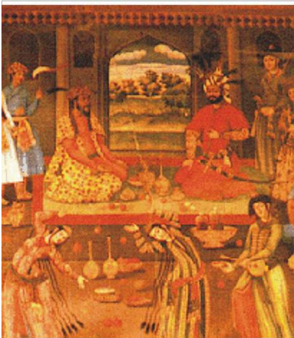
Прием иностранных послов шахом Тахмасибом I