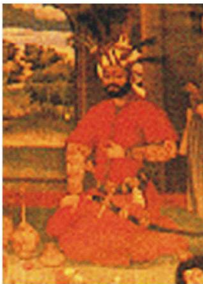
Шah Тахмасиб I (1524-1576 гг.)