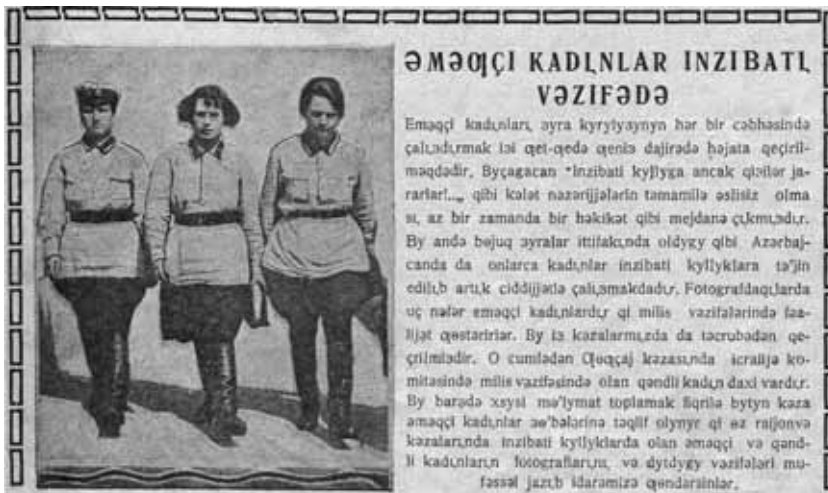
Трудящиеся женщины на административной работе