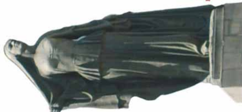
Освобожденная женщина. Скульптура Ф. Абдурахманова