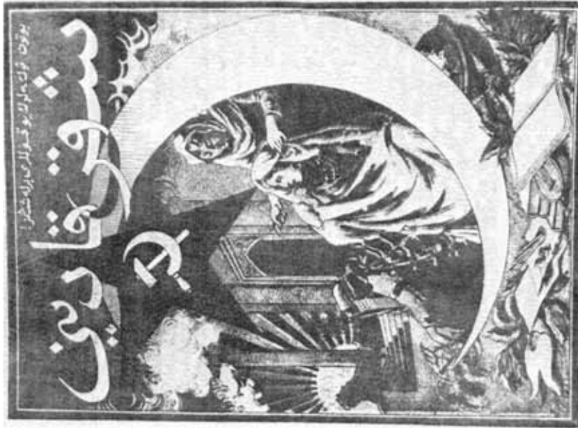
Обложка первого номера журнала "Шарг гадьны" ("Женщина Востока")