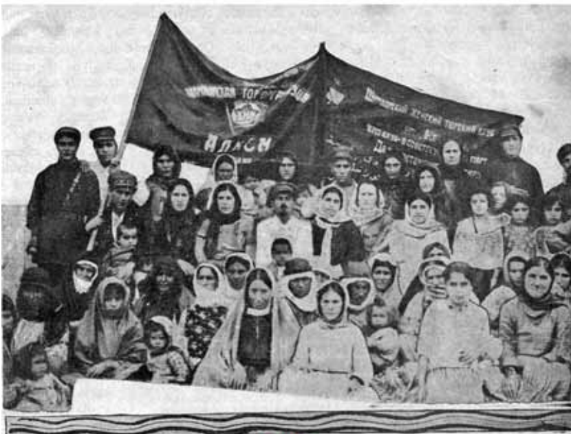
Женщины селения Мору Шамхорского уезда во время выборов в делегатские собрания (1928 г.)