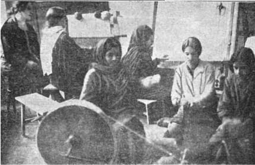
Ковроткачихи (клуб им. Али Байрамова)