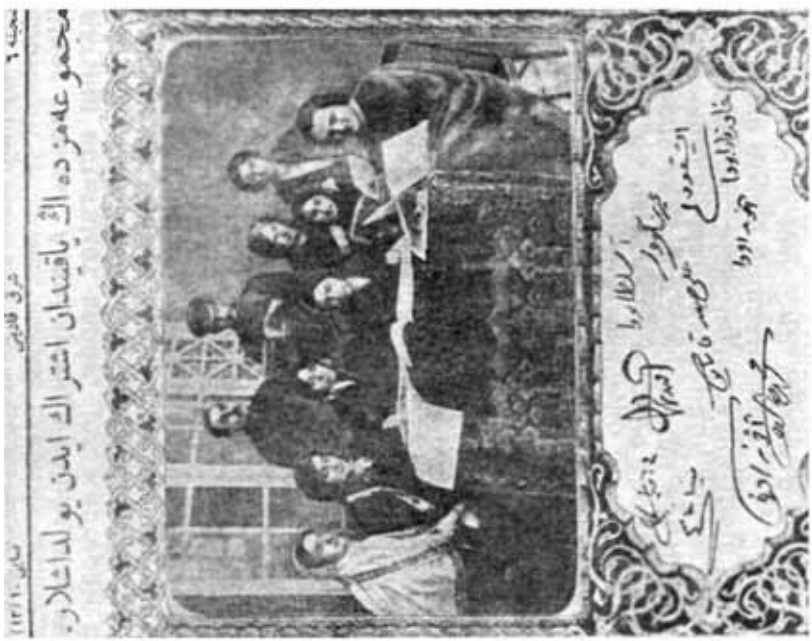
Активисты и члены первой редакции журнала "Шарг гадьны"