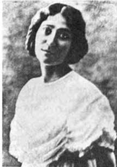
Шовкет Мамедова - первая профессиональная оперная певица, народная артистка СССР (1938)