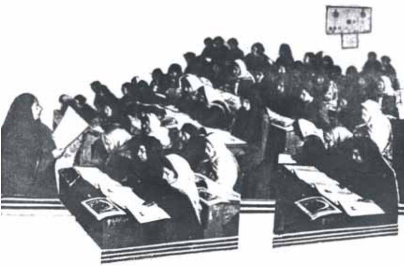
Женщины - азербайджанки на курсах по ликвидации неграмотности при клубе им. Али Байрамова