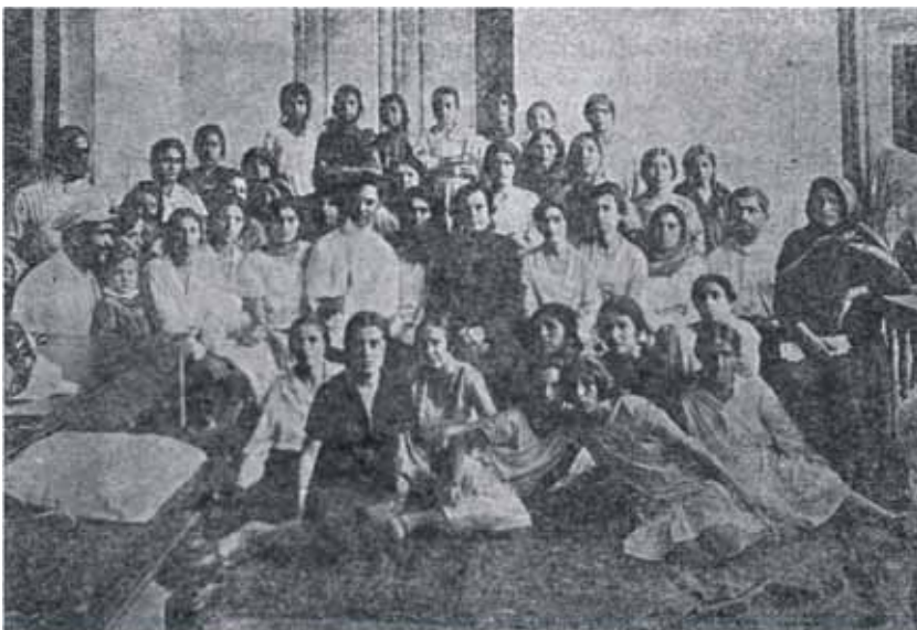
Женщины, работающие в чулочной и швейной артелях в Закаталах