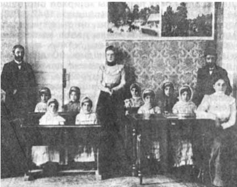
Учителя иреванской русско-мусульманской школы среди учениц