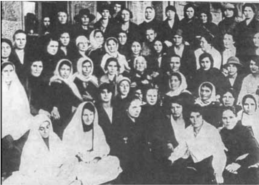
Клара Цеткин среди участниц женского клуба им. Али Байрамова (1924 г.)