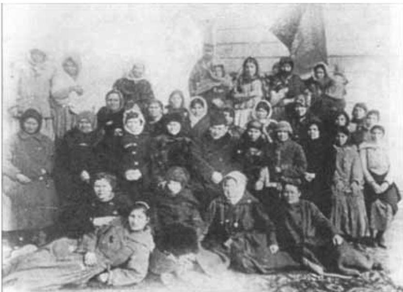
Н.Нариманов среди делегатов I беспартийного съезда женщин Азербайджана (1921 г.)