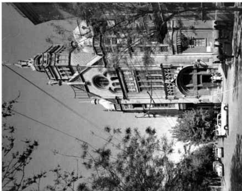
Здание женского клуба им. Али Байрамова