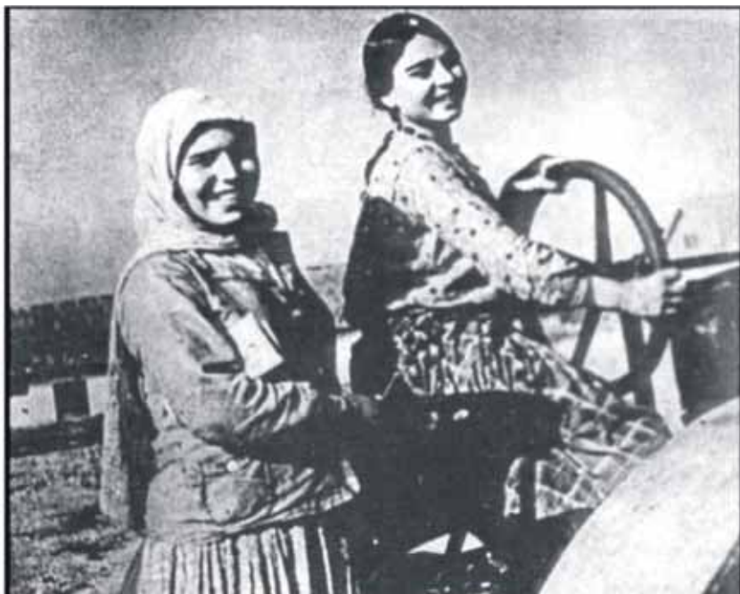
Отличницы курса трактористов при МТС Кюрдамирского района