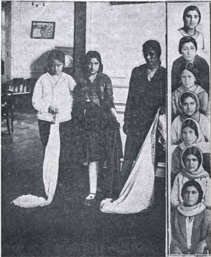
Женщины - азербайджанки, сбросившие чадру