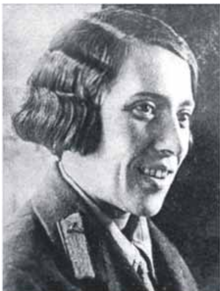
Лейла Мамедбекова - первая летчица Азербайджана