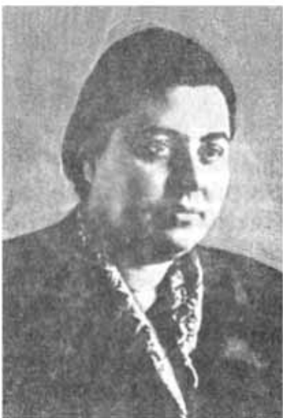
Чимназ Асланова - депутат Верховного Совета СССР (1938)