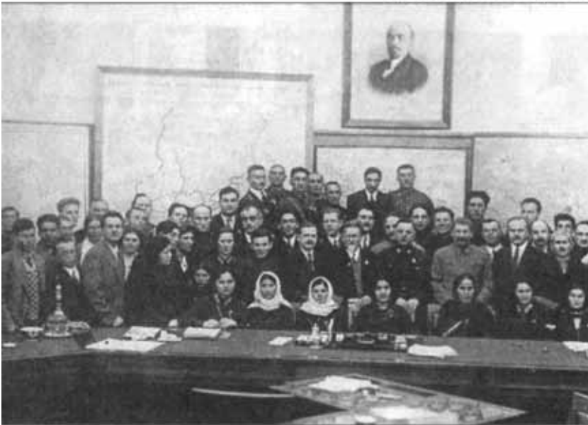
Прием делегации из Азербайджана в Кремле (1940 г.)