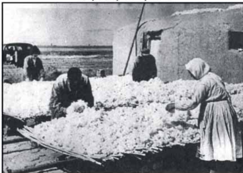
Во время сушки хлопка в колхозе “Бакы Совети” Акстафинского района