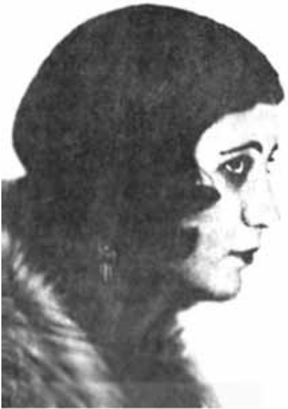
Сона Гаджиева - одна из первых актрис азербайджанской сцены