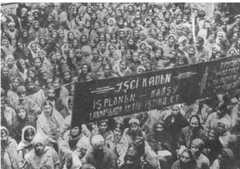
Демонстрация трудящихся женщин. Баку, 1924