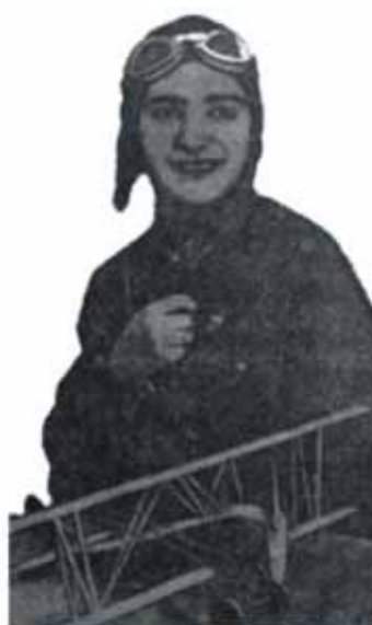
Ругия Зарбалиева - первая летчица-истребитель Азербайджана