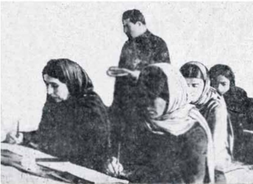
Ликвидация неграмотности женщин-азербайджанок