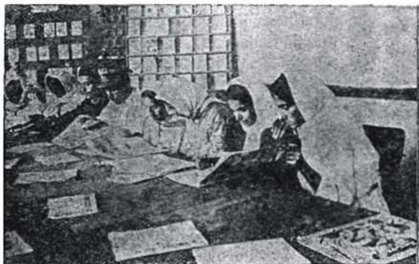
Во время отдыха женщин, обучающихся на курсах председателей Советов в Гяндже