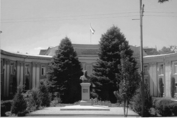
Tacikistan SSR EA-nın binası