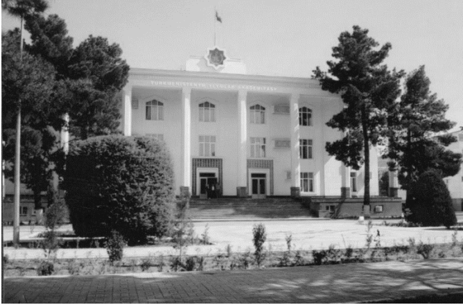
Türkmenİstan SSR EA-nın binası.