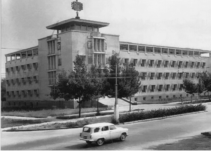
Qırğızıstan SSR EA-nın binası