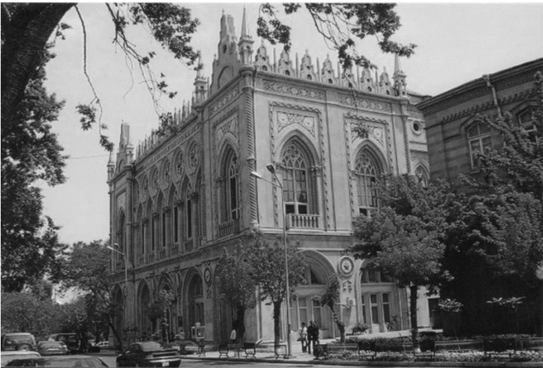
Azərbaycan SSR EA Rəyasət Heyətinin binası