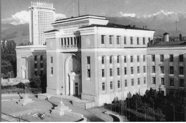
Qazaxıstan EA-nın binası