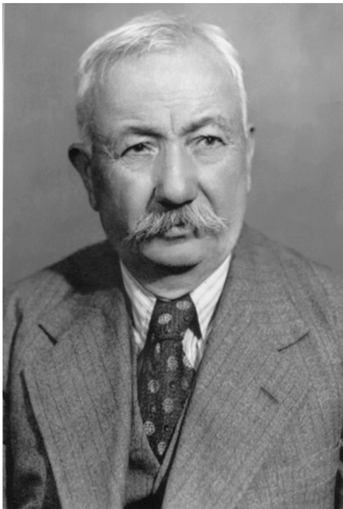
Azərbaycan SSR EA-nın ilk prezidenti (1945 - 1947): Mirəsədulla Mirələsgər oğlu Mirqasımov (1883, 17 noyabr - 1958, 20 iyul), Azərbaycanın ilk tibb elmlər doktoru, professor, alim-cərrahı, Azərbaycan SSR Əməkdar elm xadimi, SSRİ Ali Sovetinin 1-3 çağırış deputatı.