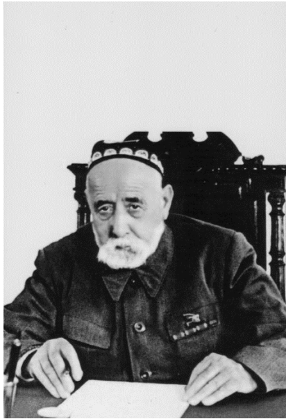
Tacikistan SSR EA-nın ilk prezidenti (1951-1954): Sədrəddin Səidmurad oğlu Ayni (1878, 15 (27) aprel - 1954, 15 iyul), görkəmli yazıçı, alim və ictimai xadim.