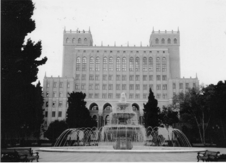
Azərbaycan SSR EA-nın əsas binası