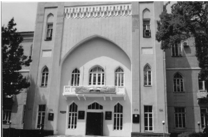
Özbəkistan SSR EA-nın binası